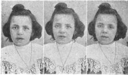
Fig. 17. Position des lèvres pour les voyelles e en parisien.

matérialisation de l'articulation qui aboutit à une sorte de cartographie du vocalisme et du consonantisme français.